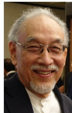
東京工業大学名誉教授 清水優史